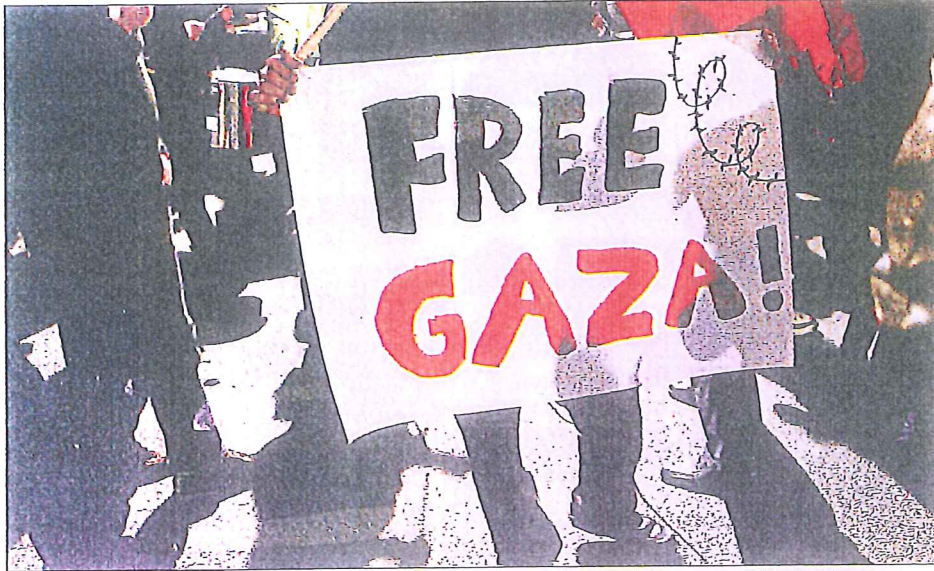
Venstreorienterte aktivister demonstrerte i Tel Aviv 2. januar, for å markere at det er ett år siden krigen på Gazastripen startet.